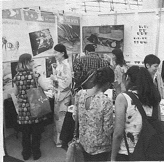
「フィールウェアプロジェクト」と銘打って三条市の製造業者が出展したイベント＝7月、ロンドン

三条市の金属加工業3社が、「かわいい」といった感性と自社の職人の技を融合させた製品作りに取り組んでいる。爪切りや工具箱など一見、「かわいい」とは無縁の製品をデコレーションやデザインでかわいいと感じられるように仕立て、積極的にPRする。三条と接点のない女性や日本文化への注目が高まっている海外で新たな顧客層をつかみたい考えた。